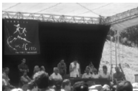
Discours anniversaire à Peisey-Nacroix (porte de Rosuel) le 21 juin

Le 21 janvier 2003, le député du Var Jean-Pierre Giran recevait mission du premier ministre afin de "mettre en perspective la place des parcs nationaux dans la gestion du patrimoine naturel national, puis faire des propositions sur les points suivant " :