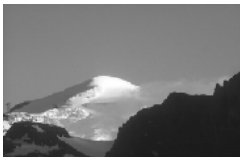
La Grande Motte

SOU MIS AU DEVOIR DE R SERVE IMPOS LA FONCTION PUBLIQUE, CE GARDE-MONITEUR A SOUHAIT GARDER L'ANONYMAT