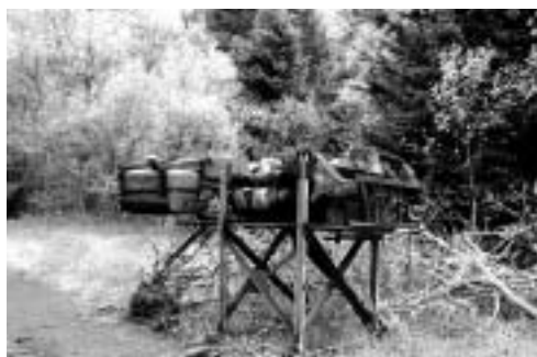
Démontage de la station de la Haute Vallée en Livradois Forez