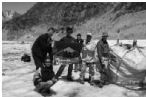
Nettoyage de la Mer de glace

CETTE ANNÉE 2007 AURA ÉTÉ TRÈS FRUCTUEUSE EN OPÉRATIONS DE NETTOYAGE : MER DE GLACE, LIVRADOIS-FOREZ ET MERCANTOUR. TROIS OPÉRATIONS POUR ALLÉGER LES MONTAGNES DE PRÈS DE 50 TONNES DE RESTES MILITAIRES OU TOURISTIQUES.