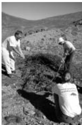
Nettoyage dans le Mercantour

Nous tenons à remercier vivement tous les bénévoles qui se sont investis dans ces opérations, que ce soit pratiquement lors des nettoyages, mais aussi durant la phase de préparation.