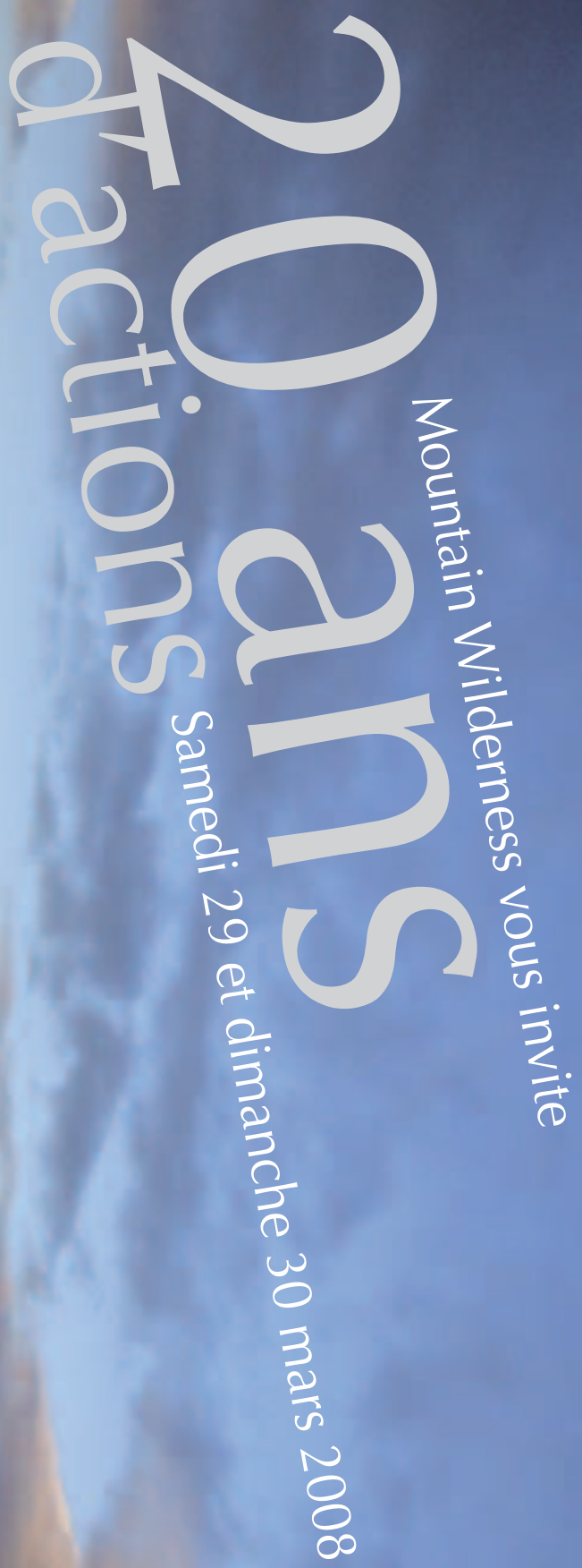
Table-ronde « Quelle montagne en 2028 ? » - sam. 29 Hôtel de Ville de Grenoble 9 h 30 - 13 h

Conférences-diaporama suivi d'une discussion sur les expéditions lointaines - sam. 29 Maison du tourisme 15 h - 17 h 45