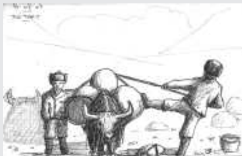
Dessins Olivier Paulin

le nier. Dans un tel cas, quelqu'un pourrait, pas complètement à tort, nous accuser d'avoir été les naïfs initiateurs du désastre, tout comme les missionnaires représentaient autrefois les avant-gardes des colonisateurs du tiers-monde. Nous étions conscients dès le début, en 2003, qu'il s'agissait d'un défi, non dénué de risques. Et nous l'avons accepté. Ceux qui agissent peuvent parfois se tromper. Ceux qui ne font rien se trompent toujours. Mais il y a autre chose. Nous avons cru qu'il était de notre devoir de donner un espoir aux populations locales extrêmement pauvres, anéanties par un quart de siècle de guerres et de dévastations. Espoir économique, certes, mais aussi culturel, basé sur le développement d'une activité pacifique et « normale » qui permette un petit revenu supplémentaire et en même temps donne aux plus capables et aux plus motivés la fierté de pouvoir offrir aux visiteurs étrangers une assistance qualifiée, d'égal à égal. C'est pourquoi nous avons déjà organisé sur les