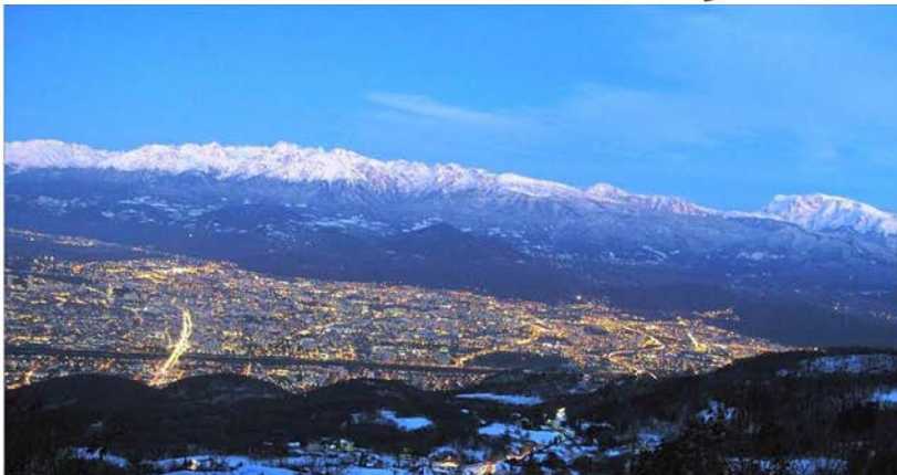
L'aspiration des citadins à une montagne "nature" pose notamment la question de l'accès à ces territoires.

Quatorze ans après leur création, les Rencontres du cinéma de montagne de Grenoble avaient conjugué l'an dernier la projection à la réflexion. Le mouvement s'accroît cette année pour « susciter le débat et construire une vision partagée ».