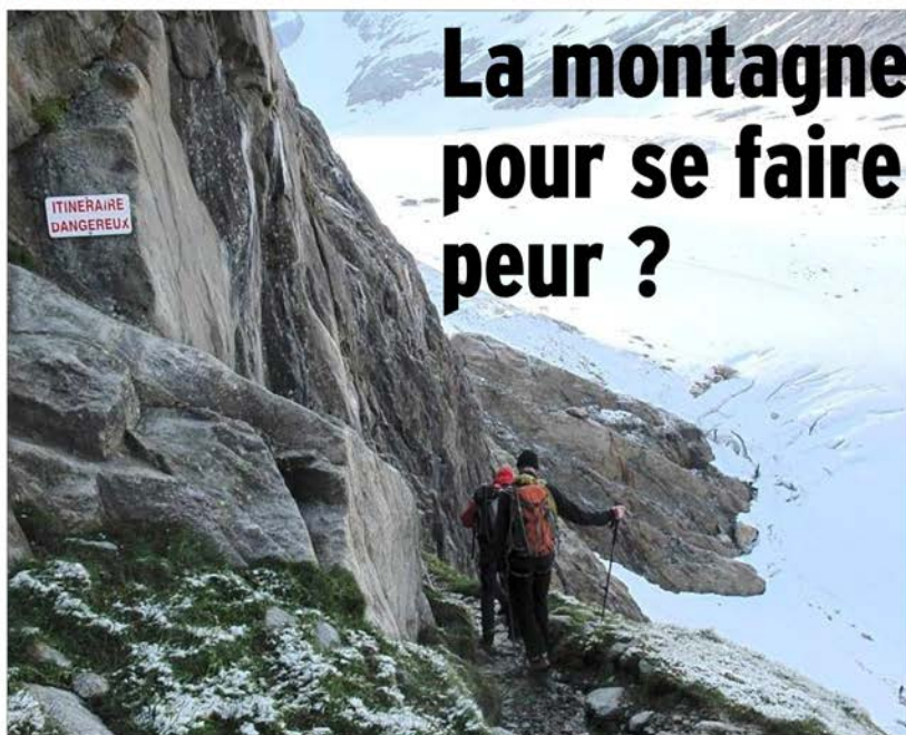
Pour éviter un passage désormais dangereux sur le glacier de Tré la Tête, en Haute-Savoie (ci-dessus), les guides haut-savoyards et la société iséroise Petzl ont dessiné un nouveau tracé qui minimise singulièrement la prise de risque jusqu'au refuge des Conscriots.

GRENOBLE | Les Rencontres du cinéma de montagne se poursuivent jusqu'à ce soir au Summum, avec des projections et des débats