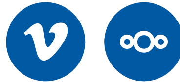
La vie en bas